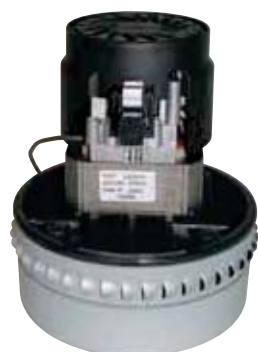
ASPIRAPOLVERE/LIQUIDI MOTORE BISTADIO BY PASS