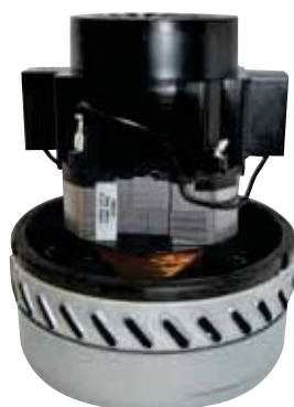
ASPIRAPOLVERE/LIQUIDI MOTORE BISTADIO BY PASS