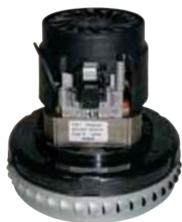
ASPIRAPOLVERE/LIQUIDI MOTORE MONOSTADIO BY PASS