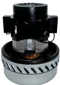
ASPIRAPOLVERE/LIQUIDI MOTORE BISTADIO BY PASS